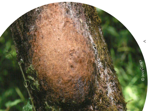
< nid de la processionnaire du chêne

La chenille se développe en automne et passe tout l'hiver dans l'œuf. En début de la période de végétation (fin avril, début mai), les chenilles éclosent. Elles passent alors par 6 stades de développement pour arriver à la nymphose. Dès le début, les chenilles sont très poilues, elles ont d'abord une coloration brun-jaune qui deviendra par la suite noir-bleuâtre. Sur 8 segments de l'abdomen, la chenille porte des zones constituées de poils soyeux de couleur brun-rouge, appelées miroirs. Sur ces derniers se trouvent à partir du 3 ème stade larvaire, des poils pourvus d'aiguillons urticants qui contiennent une toxine appelée thaumétopoéine. Le nombre, ainsi que la longueur de ses poils irritants augmentent avec chaque mue de la chenille. A la fin du 6 ème stade larvaire, la chenille peut atteindre une taille de 4 cm.